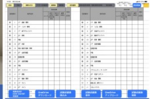
iPadアプリ画面 現場測定